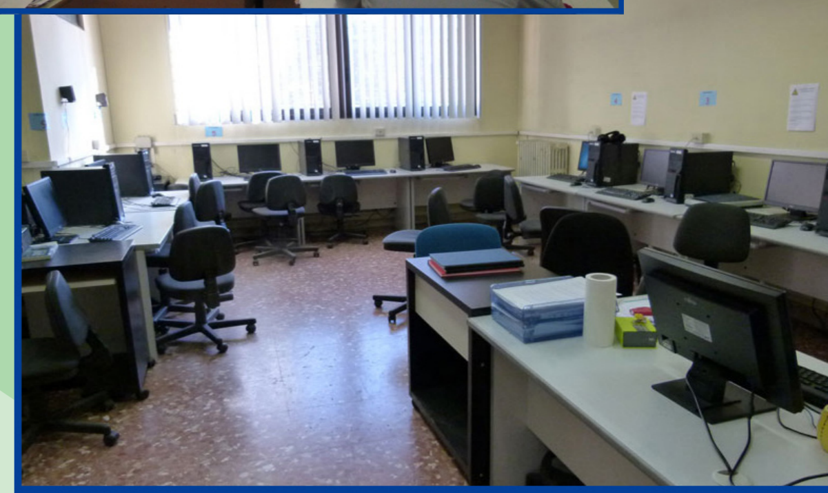
Laboratorio di Informatica (sede centrale)