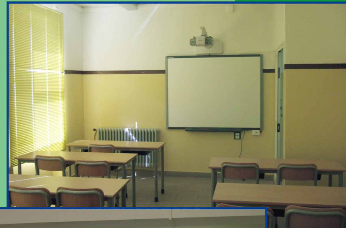
Lavagna Multimediale (sede succursale)