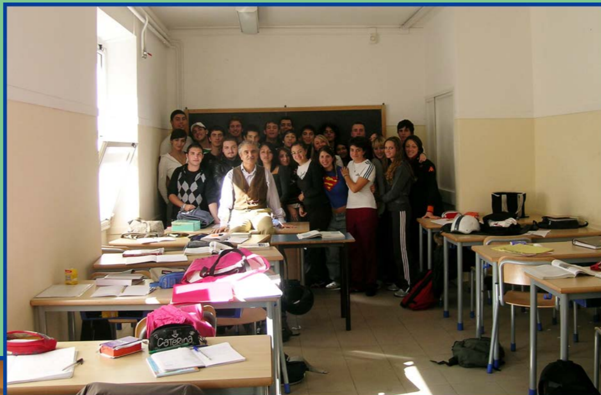
Aula (sede succursale)