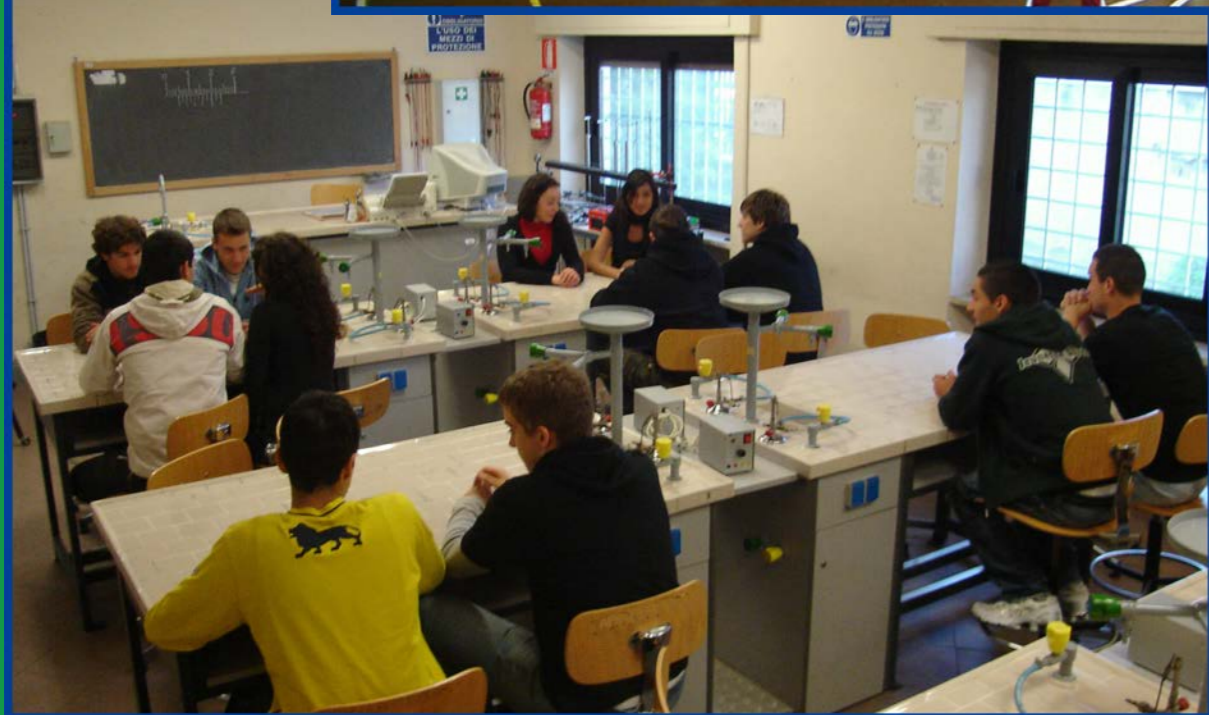
Laboratorio di Chimica e Fisica (sede centrale)